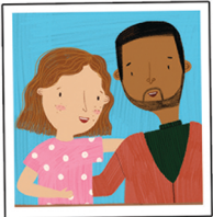
die Mama der Papa