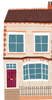
In einem Haus?