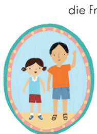
die Cousine der Cousin