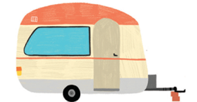
In einem Wohnwagen?

Was machst du gern mit deiner Familie und deinen Freunden?